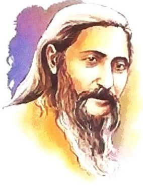
सूर्यकान्त त्रिपाठी 'निराला'